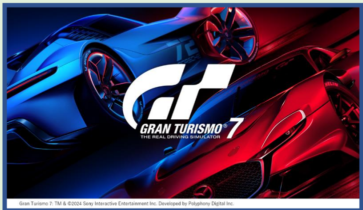
Gran Turismo 7™ & ©2024 Sony Interactive Entertainment Inc. Developed by Polyphony Digital Inc.